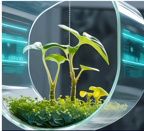
Clean and resource efficient technologies